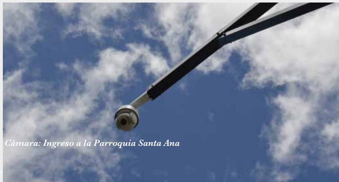
Cámara: Ingreso a la Parroquia Santa Ana