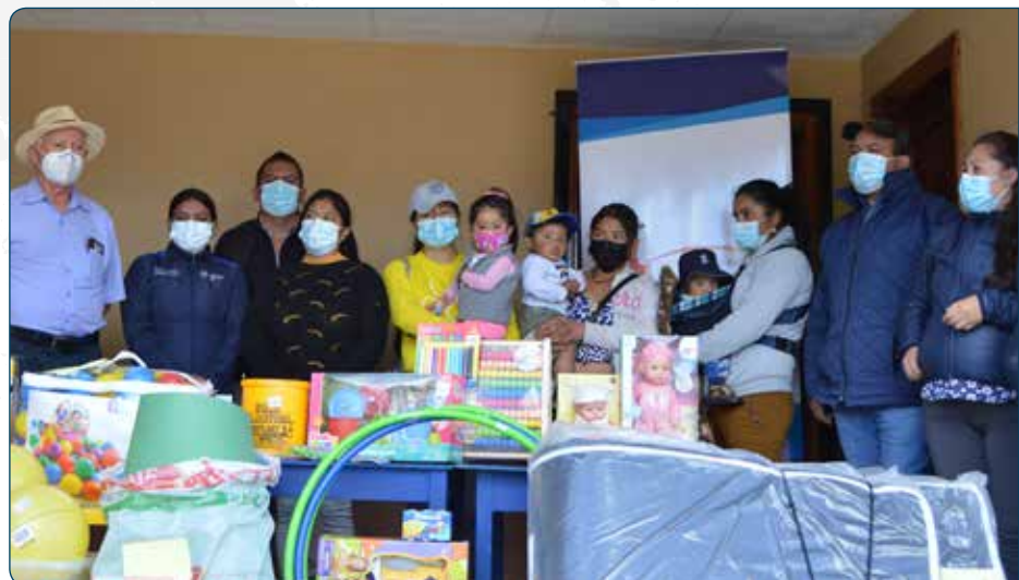
Dotación de material didáctico a la Unidad de Atención CNH Caritas Felices – La Dolorosa

Planificado: 116 niños, niñas Ejecutado: 126 niños, niñas Porcentaje: 108 %