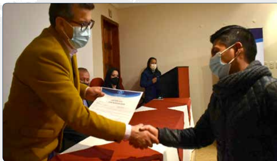
Entrega de certificados del 1 er curso sobre Metal mecánica