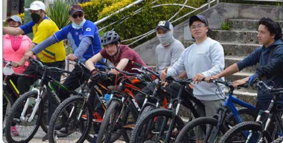
Organización de ciclo-paseo como impulso al tema deportivo

Además, existen un sinnúmero de actividades en donde se ha colaborado y que han beneficiado a los habitantes de la parroquia.