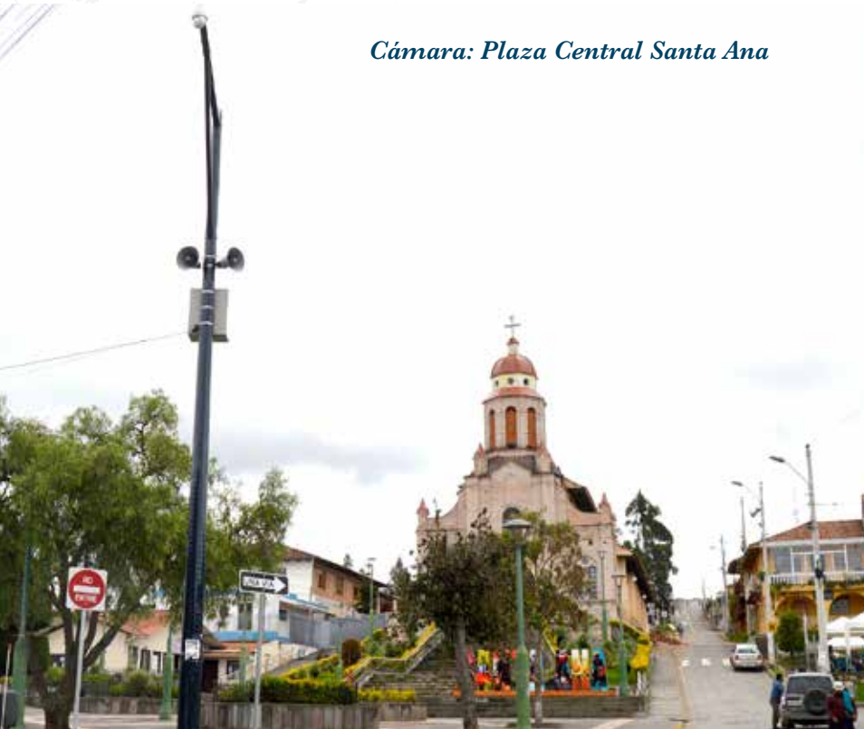
Cámara: Plaza Central Santa Ana