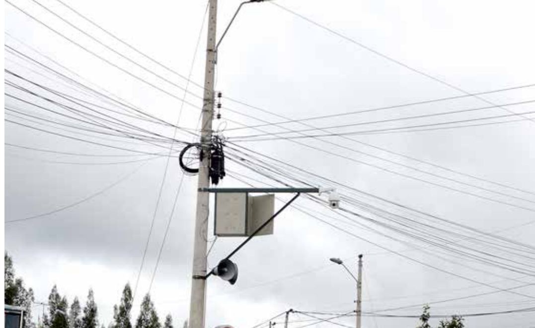
Cámara: Ingreso al Centro Parroquial