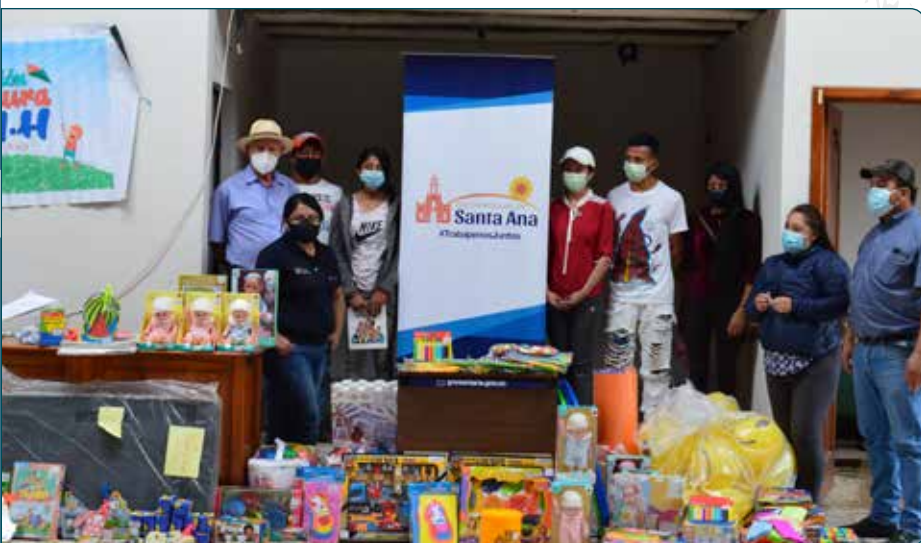
Dotación de material didáctico a la Unidad de Atención CNH Santa Ana – Centro

La entrega de los materiales didácticos se realizó en los centros de atención grupal de las diferentes Unidades de Atención.