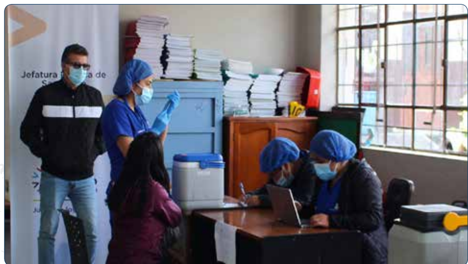
Vacunación de adultos mayores contra la COVID-19