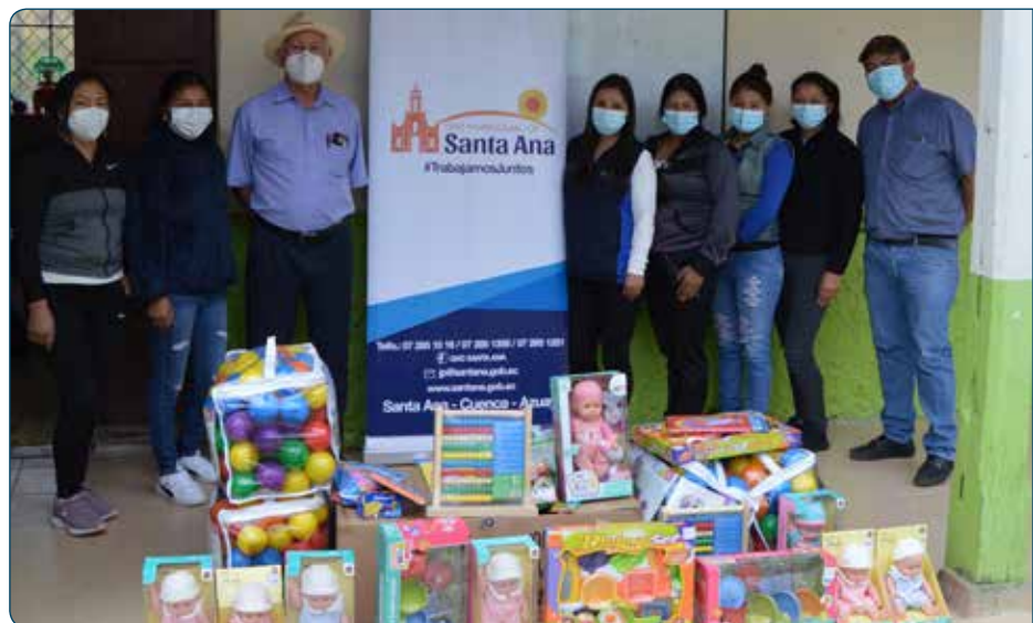
Dotación de materiales didácticos a la Unidad de Atención CDI -Ingapirca